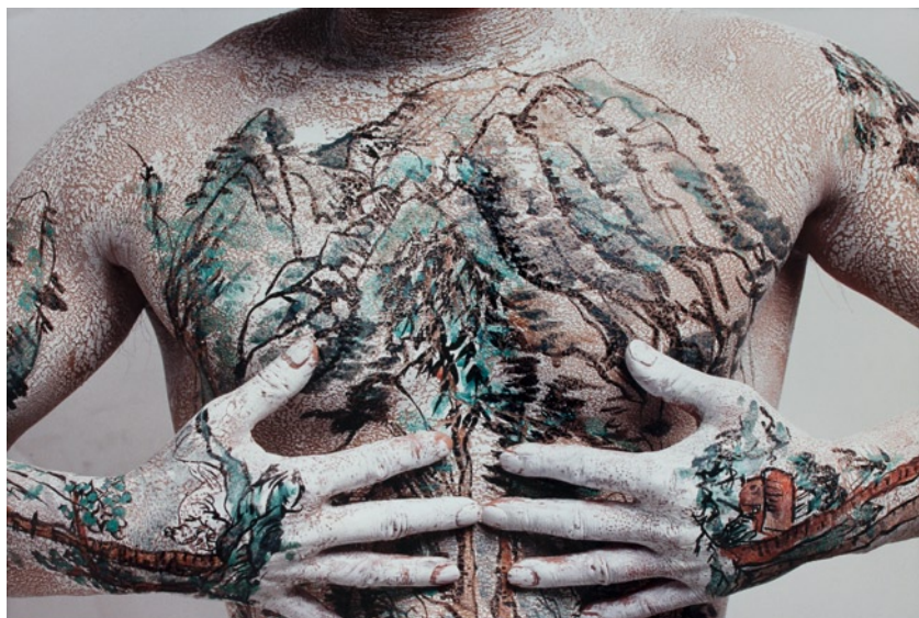
Huang Yan , Chinese Landscape – Tattoo No. 5, 1999; Courtesy M+Sigg Collection, Hong Kong. By donation