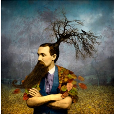
Maggie Taylor, Subject to Change, 2004