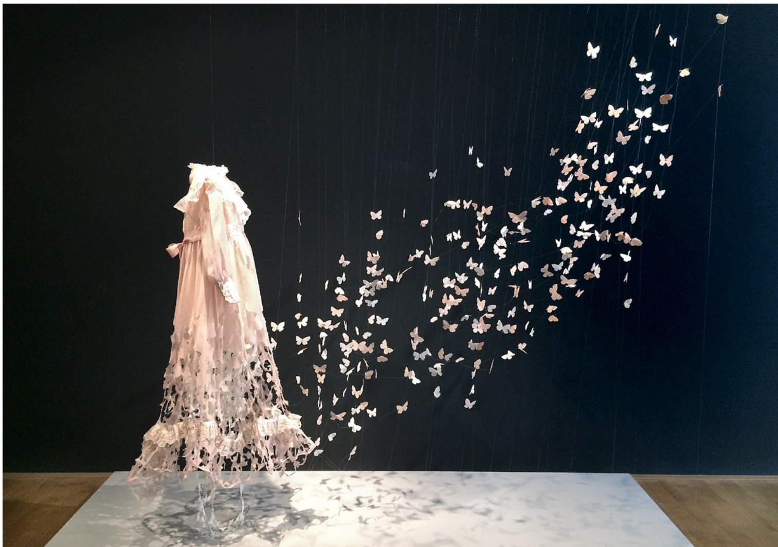
Su Blackwell, While You Were Sleeping , 2004 © Su Blackwell