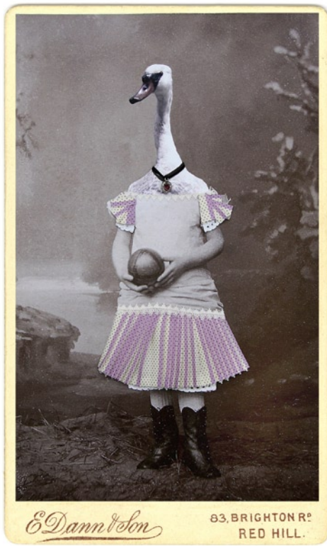
Charlotte Cory, Swangirl, 2009