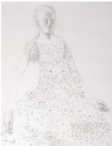
Juul Kraijer, Untitled, 2002; © Juul Kraijer

Zeichne eine menschliche Figur, die nur aus Pflanzen besteht.