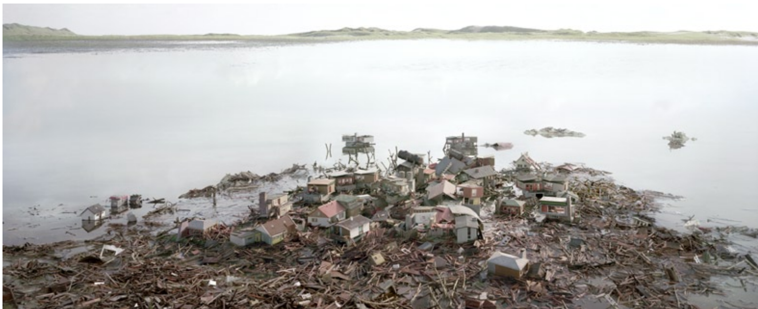
Thomas Wrede, Nach der Flut 1 , (Ausschnitt), 2012; © Thomas Wrede, VG Bild-Kunst, Bonn 2017