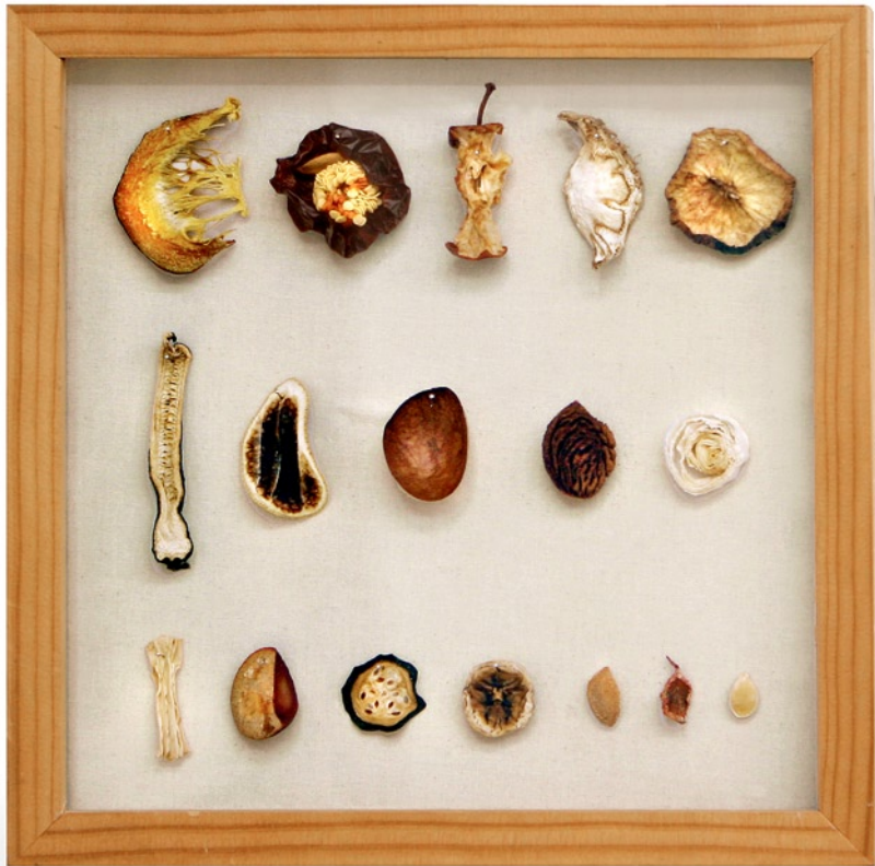
Laura Kuch, Display Cabinet #1 „First ever seen by me“ , 2011, Geschnittene und getrocknete Früchte, Gemüse und Kerne; © Laura Kuch

Betrachte jedes Ding im Kunstwerk von Laura Kuch ganz genau.