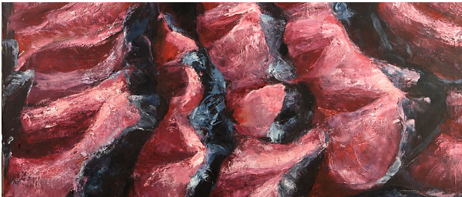
Juliane Gottwald, Pflaumenkuchen (Ausschnitt), 1997, Öl auf Leinwand; © Galerie F.A.C. Prestel