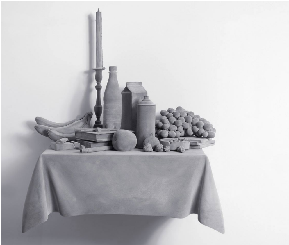
Hans op de Beek, Vanitas (variation) 1 , 2015, Holz, Gips; © Hans op de Beek, Foto: Bill Orcut