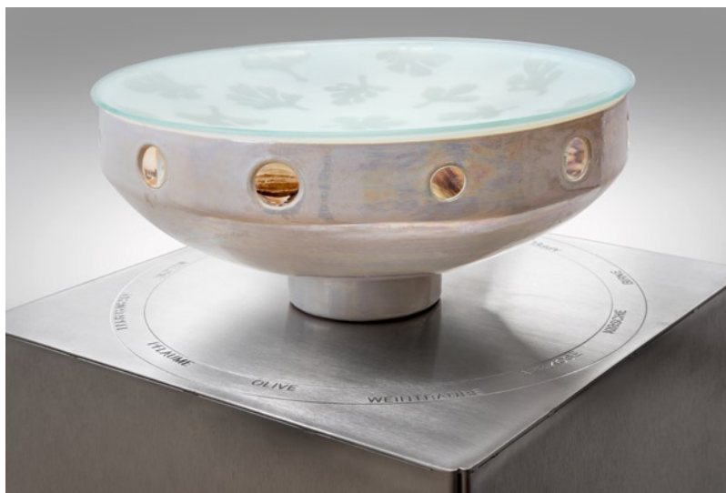
Roland Stratmann , Fruchtkernmuseum , 1997, Keramik, Glas, Stahlblech und Fruchtkerne; © VG Bild-Kunst, Bonn

Apfelkerne, Kirschkern, Aprikosenkerne, Dattelkerne, Pfirsichkerne, Olivenkerne, Pflaumenkerne, Litschikerne, Traubenkerne, Avocadokerne