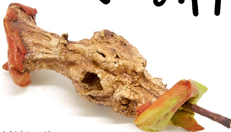
Gavin Turk, Gala (eaten apple) , 2011 Bronze, bemalt; © Gavin Turk