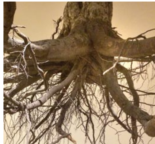
Giuseppe Licari, Humus , 2017, Bäume aus dem Schlosspark Bad Homburg; © Giuseppe Licari