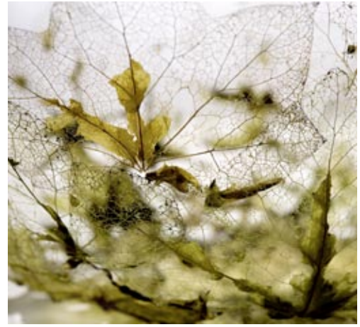
Stella Jazenko, Hedera , 2016

Die Studierenden der Hochschule für Gestaltung Offenbach haben mit verschiedenen Materialien aus der Natur experimentiert, um daraus neue Designs zu entwickeln, die in der Zukunft für unseren Alltag nützlich sein könnten.