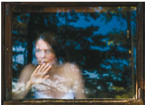
Aino Kannisto, Untitled (Sauna Window), 2015