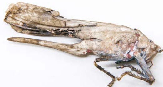
Lea Grebe, Grashüpfer, 2018

Seit jeher ist die Beziehung von Mensch und Insekt von Ambivalenzen bestimmt: Nutzen und Schaden, Fluch und Segen, Faszination und Phobie. Das drängende Thema des Insektensterbens jedoch hat den Blick des Menschen auf die kleinen Kerbtiere verändert: Ihre unabweisliche Bedeutung für das fragile ökologische Gleichgewicht und die Biodiversität der Natur ist in den Fokus geraten. Ihre zunehmende Abwesenheit wird immer spürbarer und damit wächst auch die Sehnsucht nach ihrer Rückkehr. Für die Tiere, die jahrzehntelang mit Insektengiften und -fallen vertrieben wurden, werden nun „Insektenhotels“ im Garten installiert und Bienenstöcke allerorten aufgestellt. Das Museum Sinclair-Haus stellt in der Ausstellung ARTENREICH Künstlerinnen und Künstler vor, die diese Verschiebung in der Beziehung von Mensch und Insekt mit ihren Arbeiten erspüren und sich den fremdartigen Wesen annähern. So sind in der Ausstellung Skulpturen, Reliefs, Zeichnungen, Fotografien, Filme und Installationen zu entdecken, die allesamt rund um das Thema „Insekt“ kreisen.