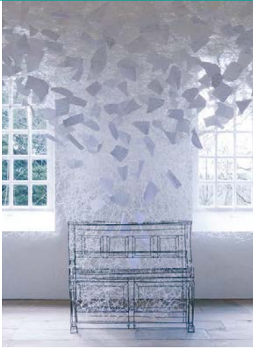
Chiharu Shiota, Beyond Time, Yorkshire Skulpture Park, 2018