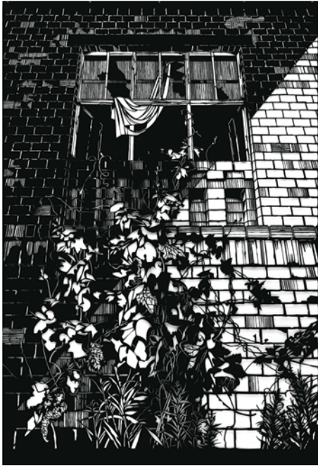
Annette Schröter, Wildwuchs 2, 2006 Titel: Aino Kannisto, Untitled (Scene Outside), 2011 (Detail)